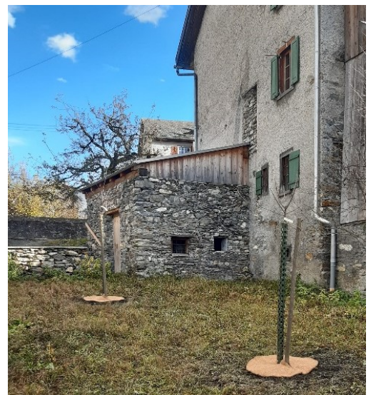
Die neu gepflanzten Obstbäume

Auch bei den Umgebungsarbeiten ging's vorwärts. Mit dem Pflanzen von zwei einheimische Obstbäumen und der Anschaffung von zwei einfachen Bänklein vor dem Vieh-Stall sind wir dem Ziel, einen traditionellen Hausbongert zu realisieren, einen grossen Schritt näher gekommen.