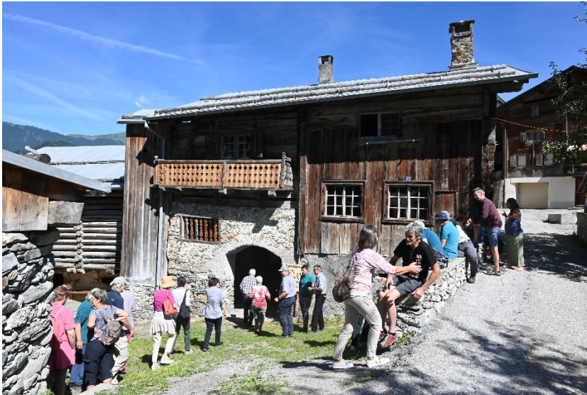
BesucherInnen der Ausstellung