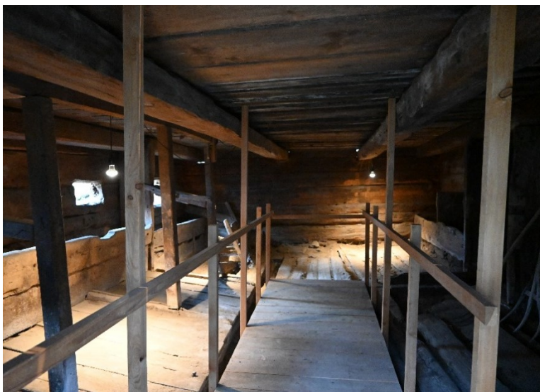
Blick in den historischen Kuhstall