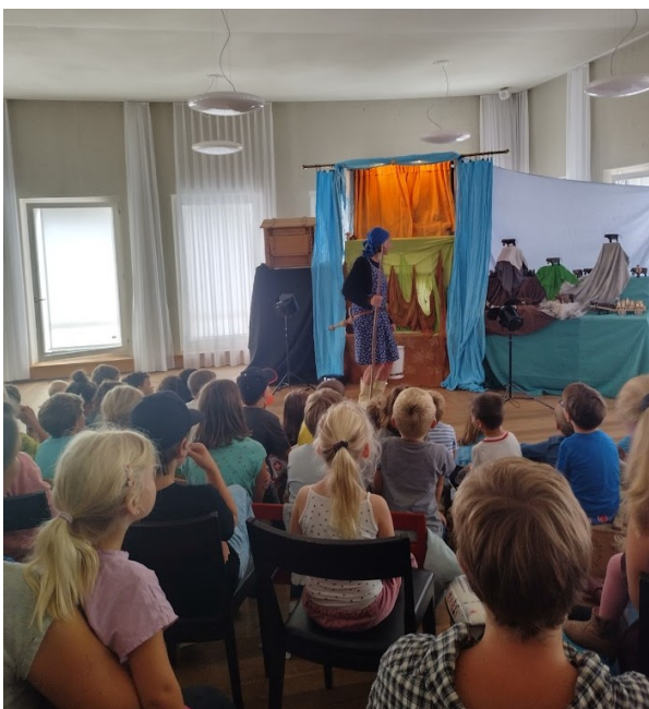
Das Kasperlitheater war mit dem Besuch von über 70 Kindern ein Riesenerfolg.