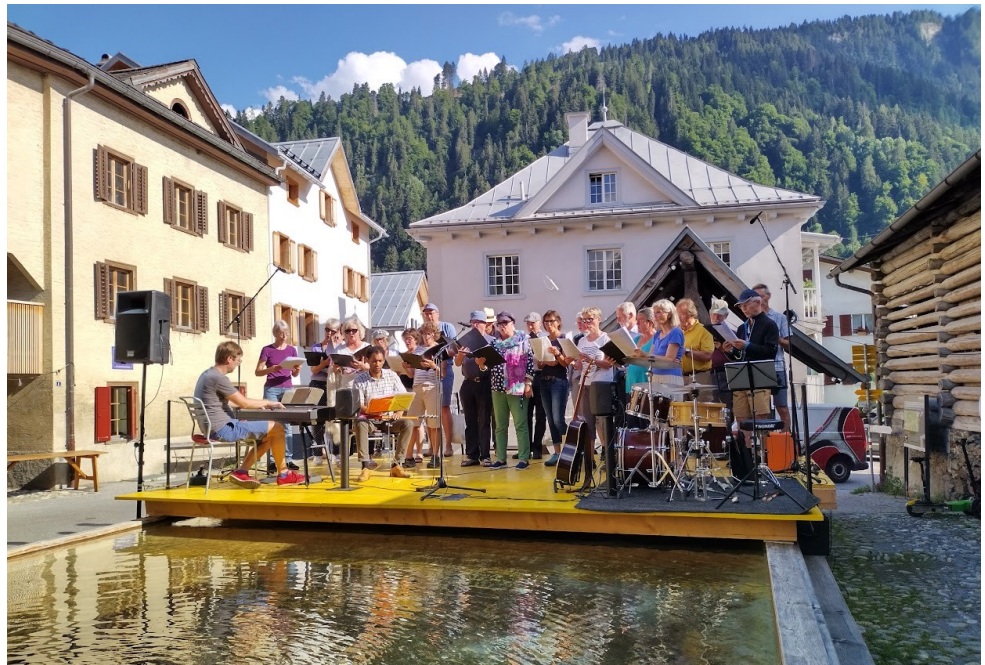
Das Brunnenfest in und auf dem Dorfbrunnen in ein- maligem Ambiente.