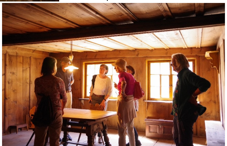
Grosse Diskussionen rund um den Stubentisch.

Auch das Zurückbringen der ausgeräumten Möbel und Gegenstände ergibt eine sehr spannende und für uns bisher unbekannte Atmosphäre im Haus.