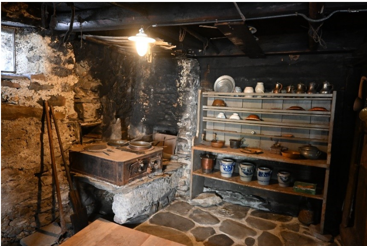
Die Küche im 1. OG mit der alten elektrischen Deckenlampe.

Bewährt hat sich die sehr zurückhaltende Elektrifizierung der Räume, in welchen bereits anfangs des letzten Jahrhunderts einfache Lampen montiert wurden. Jetzt kann das Jooshuus bei Führungen sicherer begangen werden und wirkt sehr authentisch.